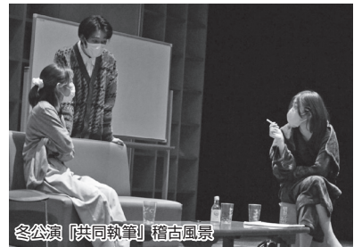
冬公演「共同執筆」稽古風景

し続けてほしいと思っております。互いに刺激し合い、日々楽しみながら稽古を続け、より多くの方々に演劇を届けられるよう努力していきたいと考えています。最後になりました