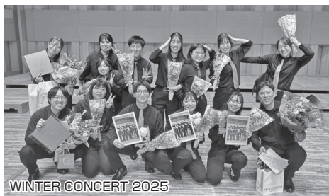
WINTER CONCERT 2025

の学びや新たな気付きを得る機会となりました。同年九月には、旭ヶ岡の家に、訪問演奏を行いました。私たちの演奏によって、利用者の方々の顔が笑顔になり、嬉しそうな様子が見られました。また、亀田八幡宮例大祭での演奏では、地域の方々と近い距離で演奏ができ、たくさんの方々から喜んでいただくことができました。十一月には、行われた函館大谷短期大学谷短祭で演奏させていただきました。様々なイベントに参加させていただきました。貴重な経験をさせていただきました。音楽を通して、多くの地域の方に出会えること、喜んでいただけることの素晴らしさを実感しました。