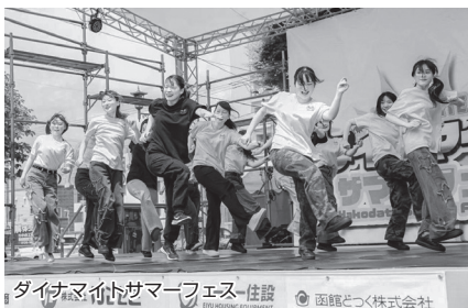
ダイナマイトサマーフェス 住設 函館どつく株式会社

二〇二五年度は、学内だけでなく、地域と関わる活動にも積極的に取り組みました。函館グリーンプラザで