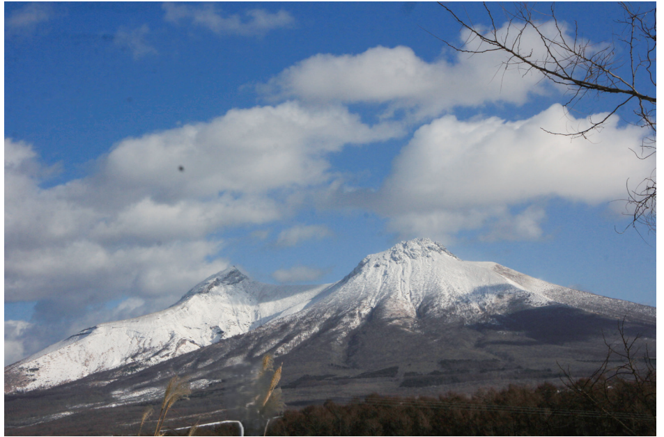
初冬の駒ヶ岳 (七飯町)

地域の教育力が低下しているという学校や地域の苦悩をよく聞く。夕陽会はその課題把握のために調査を