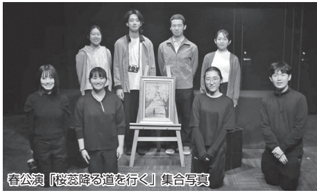
春公演「桜雲降る道を行く」集合写真

二〇二五年度は、年間で三回の公演を行いました。活動の場は校内のみならず、函館外でも公演をしました。今年度も、札幌で開催された「北海道学生演劇祭」に出場いたしました。この舞台では、公立はこで未来大学の劇団Nルーの部員と共に、他大学や他劇団と切磋琢磨し、多くの刺激を受けてきました。外部の多様な表現に触れ、交流した経験は、私たちの表現の幅を広げる良い機会となりました。また、私たちは地域に根ざした活動も積極的に行っています。七・八月に開催された「函館野外劇」には、殺陣や劇中の登場人物として参加させていただきました。歴史あるこのような舞台で、市民の皆様と共に一つの壮大な物語を作り上げたことは、劇場内での演劇とは異なる貴重な学びとなりました。二〇二五年度をもって、三年生は部活を引退します。これからの部員たちにもそれぞれの個性を大切に、様々な形で表現