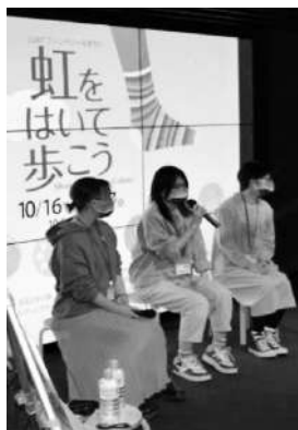
市内書店でのイベント開催

○HUEレインボーはこだてプロジェクト（性の多様性を理解し、誰もが住みやすい社会をつくるためのイベント「虹を歩いて歩こう」の開催など）