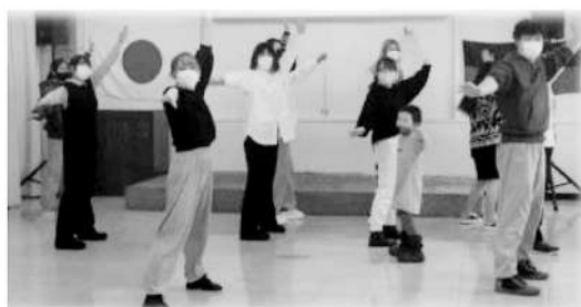
技能実習生と一緒に「よさこい」を踊る

学生は、地域が抱えている課題に地域と協働して取り組む中で、地域のニーズに応える生きた学びを通して、通常の科目では得難い実践的な能力を身に付けることができます。また、平均六～七名ずつの学生でチームを組み、地域課題の調査・分析からプロジェクトの構想・実践までを自分たちの力で行うことにより、主体的な実践力やチームワークなどを身に付けることができます。