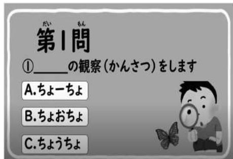
日本語学習動画（長音の表記）

また、対象児童が、一時帰国することを踏まえ、日常で使う言葉を中心に、日本語学習動画（長音についての学習）を作成した。