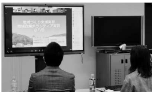
オンラインによる演習報告会 (令和4年2月3日)

夕陽会としては、今後も大学と協議、協力して学生の学びを人的・物的面で支援していきます。また、学生と協働で取り組む文化活動の工夫、学生から夕陽会への期待・要望等を聞く場や機会の設定、学生支援を機動的に行うための組織の新設なども検討していきたいと考えています。