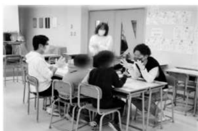
かけ算のじゃんけんゲーム